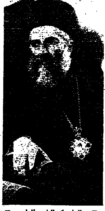
البطريك الياس الرابع